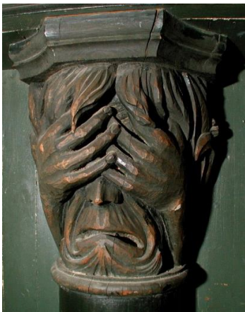
Ansikt frå Ungdomshuset Skogvang I Aure. Huset bygt i 1936. Usmykking i treskurd av billedhoggeren Kristoffer Leirdal frå Aure.