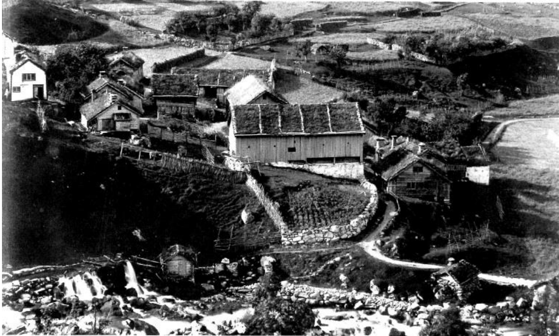
Frå Gjørva, Geiranger.