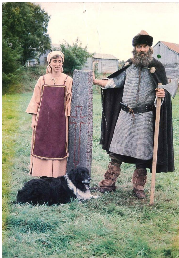
Kulisteinen, Smøla.

I 1349 kom Svartedauden til landet og til vårt fylke. Pesten halvete folketalet og førde til store endringar i samfunnet. Det skulle ta ca. 300 år før alle gardane som då blei lagt aude, var rydda på nytt. Kaupangane mista sin aktivitet og posisjon. Når handelen tok seg opp att, skjedde det i fiskeværa i ein periode med rikt fiske og gode prisar på tørrfisken hos Hanseatane i Bergen. Bud vaks fram som det viktigaste handelssenteret mellom Trondheim og Bergen på slutten av mellomalderen. Fleire av fiskeværa i fylket blei etablerte i denne perioden. I indre strøk blei Devold (i Rauma) teken i bruk som marknadsplass og møteplass mellom fjord og innland.