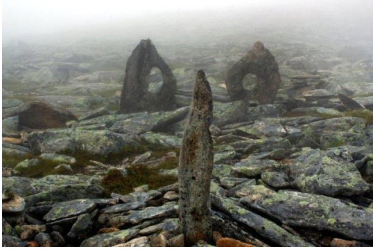
Frå Skjerdingen, Vatne i Haram.