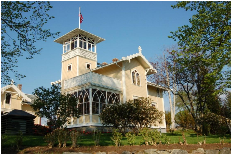
Frå Birkelund, Frei. Kristiansund.