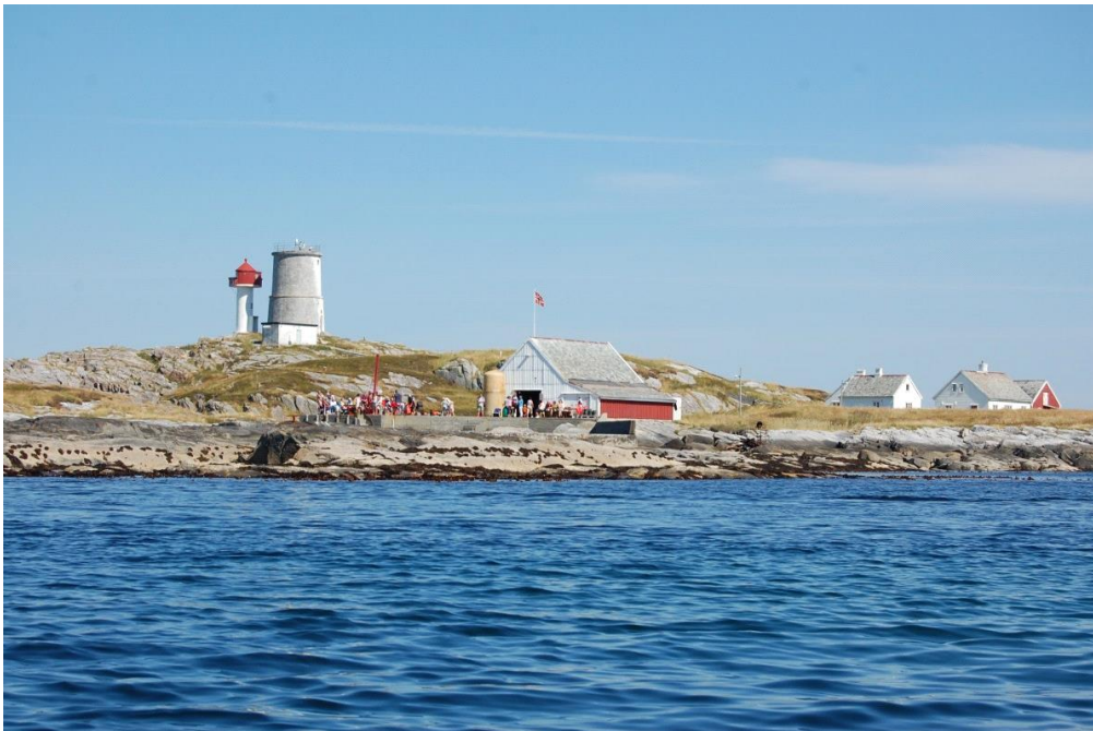
Frå Kvitholmen fyr, Eide.

Eigarane er den avgjerande faktoren om ein skal lukkast med vern av kulturminna. Ein del kulturminne er ressurskrevjande å ta vare på. I mange høve er det ikkje mangel på medvit om føremålet med kulturvern som er avgjerande, men tilgangen på ressursar for å ta vare på dei kulturhistoriske verdiane.