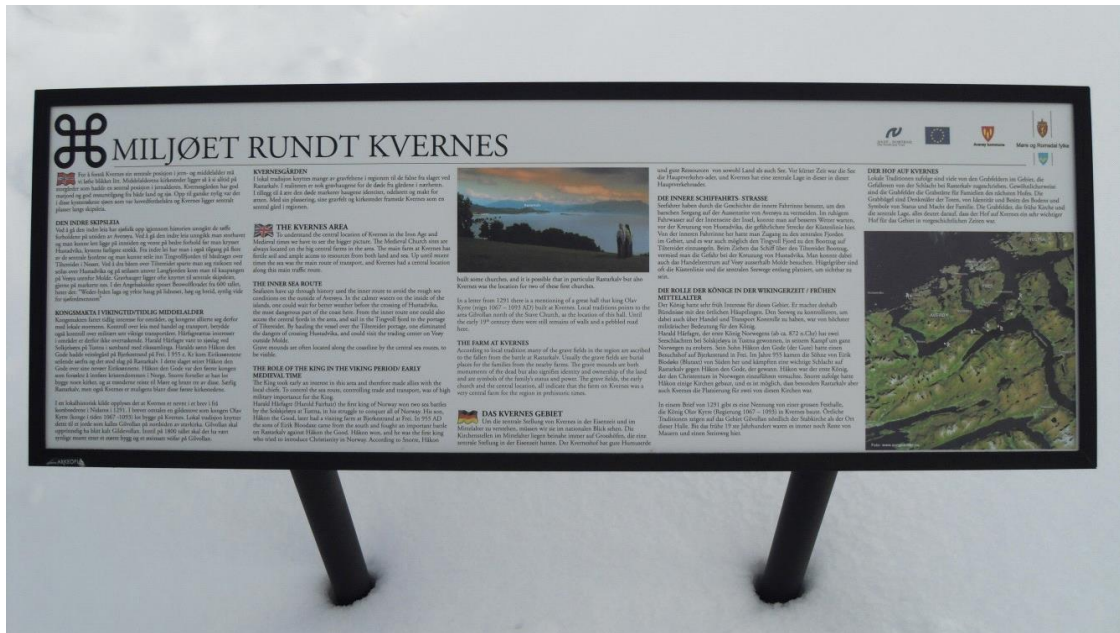
Skilting av miljøet kring Kvernes.