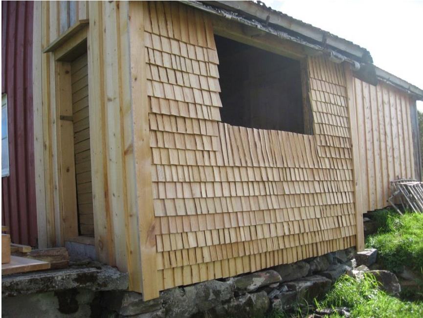
Frå Massinastua, Skotheimsvik i Fræna kommune, restaurert sponvegg. Fræna.