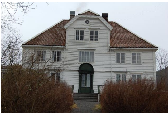
Frå Solnør, Skodje.