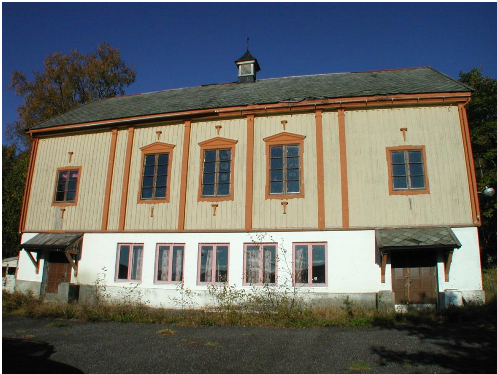
Ungdomshus, Skodje.