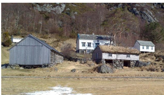
Frå Viketunet, Herøy.

Den Trondhjemske postvei som blei anlagt i 1780-åra som det første "riksvegen" gjennom fylket har nasjonal verdi som samferdselsminne. Vegvesenet har teke med enkelte strekningar og deler i sin "landsverneplan", men vi meiner ein må vurdere å ta med også andre viktige strekningar som er relativt godt bevarte. Vegen går gjennom kommunane Stranda, Ørskog, Vestnes, Molde, Gjemnes, Tingvoll, Surnadal og Rindal.