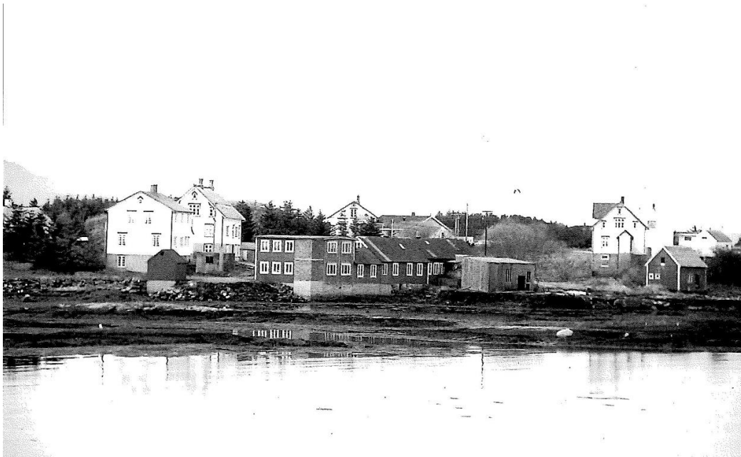
Finnøy Motorfabrikk, Sandøy.