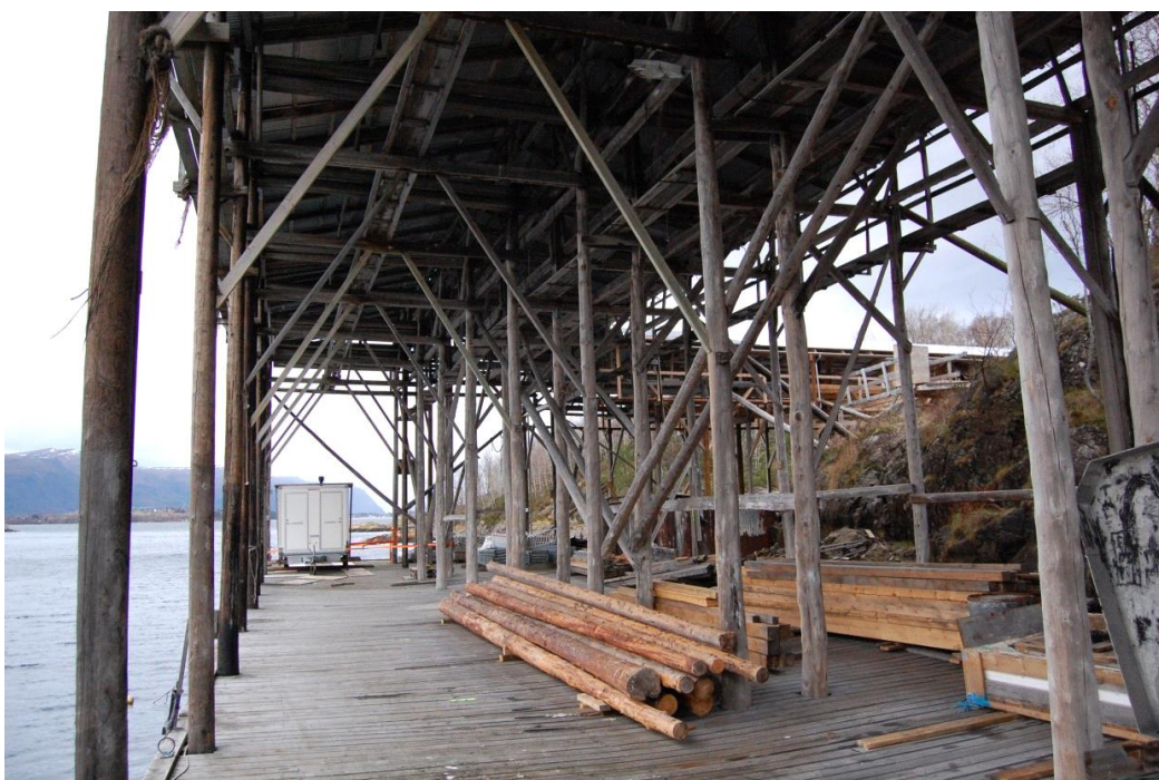
Frå Hjellens notbøteri, Leitevågen, Ålesund.