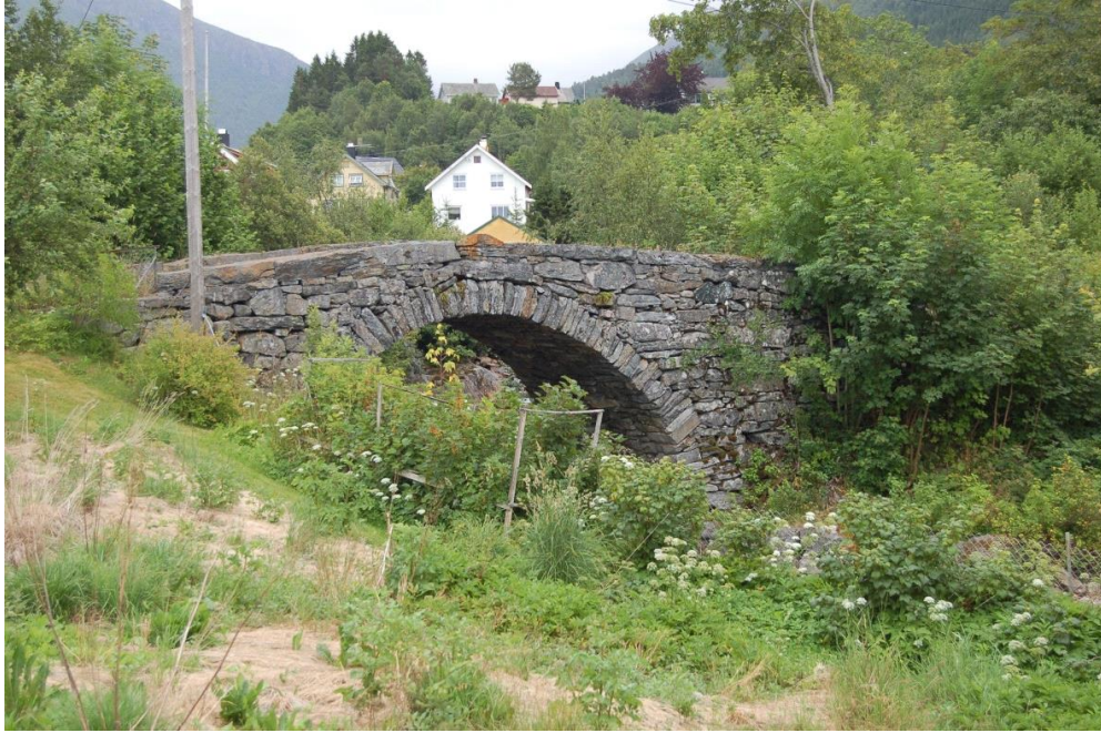
Kvelvingsbru, Vik i Sykkylven.