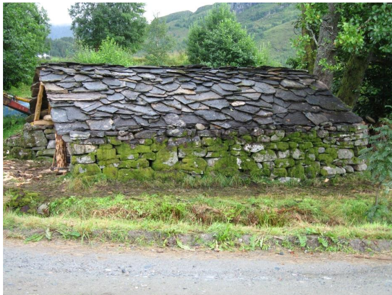
Troskot i stein, Sylte. Vanylven.