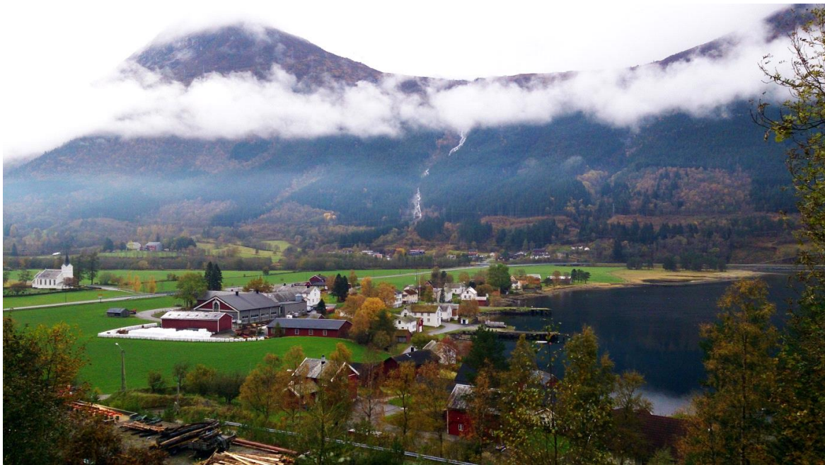
Frå Øksendalsøra, Sunndal kommune.