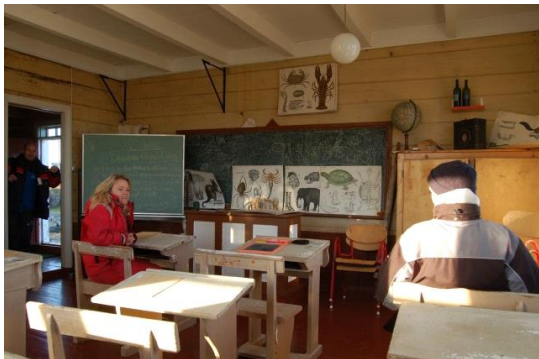
Frå Flåværvær skule, Herøy.

Utviklinga på 1800-talet i Møre og Romsdal gjekk elles i store tekk som i resten av landet. Vi fekk haugianerrørsla, bondeopposisjon, utvandring til Amerika, omlegging i jordbruket med store innmarksutskiftingar, oppløysing av dei gamle tunskipnadane og overgang frå naturalhushald til pengehushald. Dei første turistane kom til fylket og nokre få bygde seg fritidshus for å få gode friluftsopplevingar. Fast skule blei innført med lov i 1860 og ein svært desentralisert modell med små grendaskular blei utbygt.