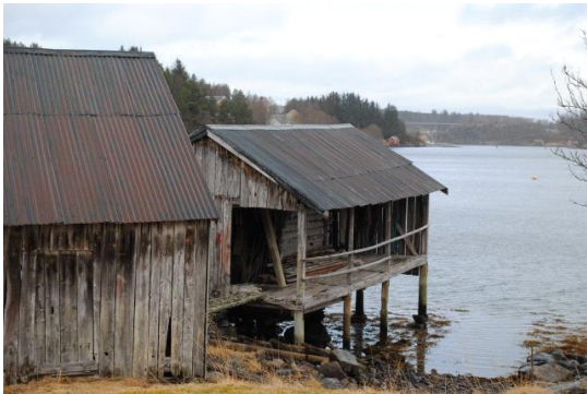
Svalgangshus, Aure.

I den nordlege delen av fylket finn vi eksempel på ein bygningskategori som er særreigen for landsdelen og som har stor tidsdjupne. Det gjeld svalgangssjøhus. Både naust og brygger er bygde med ein svalgang på eine langsida ( gjerne ut mot sjøen) til opphenging og tørking av vegn. Kjerneområdet for denne bygningskategorien er i Aure kommune, men ein finn svalgangssjøhus fleire stader på Ytre Nordmøre og også i Romsdal.