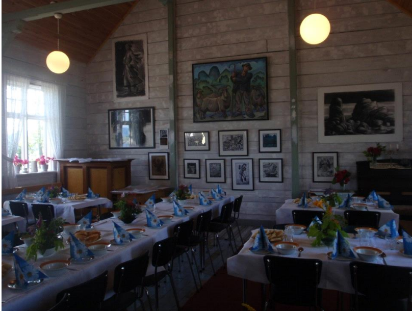
Frå Klippen bedehus, Kvernes, Averøy.