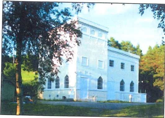
Skar kraftstasjon, Tingvoll kommune.

elementa er det derfor naturleg å sjå isamanheng. I mange kommunar har ein minner frå tiltak som har vore og er viktige også utanfor kommunegrensa. Vi har vore langt framme i tidleg fase av utbygging av elektrisitetsforsyning, noko som blir avspegla.